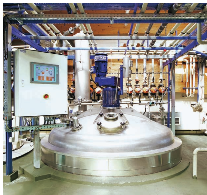
Neue Mischanlage am Brenntag-Standort in Duisburg